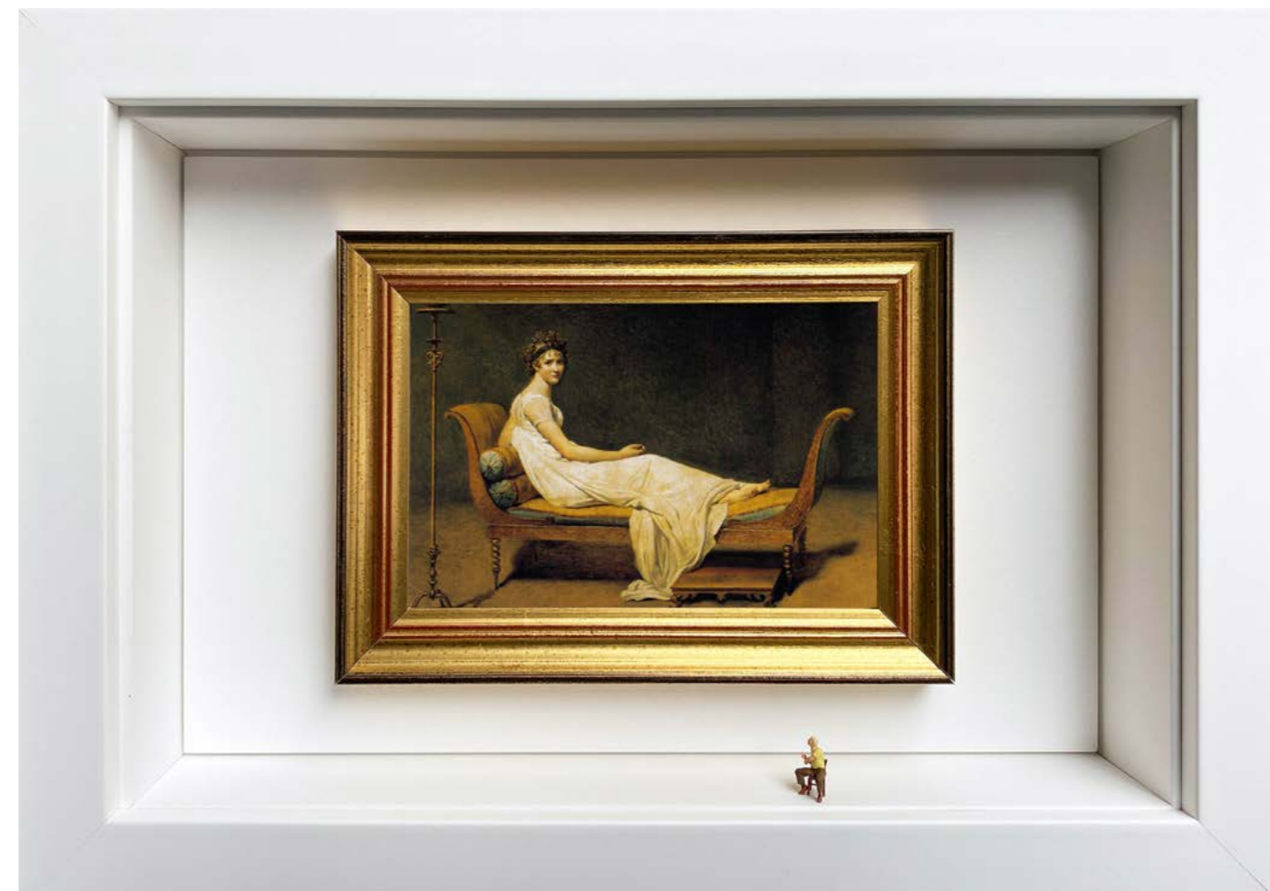
Therapy Session Édition limitée à 12 exemplaires - Limited edition of 12 34 x 24 x 6,5 cm - 13 x 9 x 2,5 inches Clin d'oeil à l'oeuvre Portrait of Madame Récamier de Jacques-Louis David (1800) A nod to the artwork Portrait of Madame Récamier by Jacques-Louis David (1800)