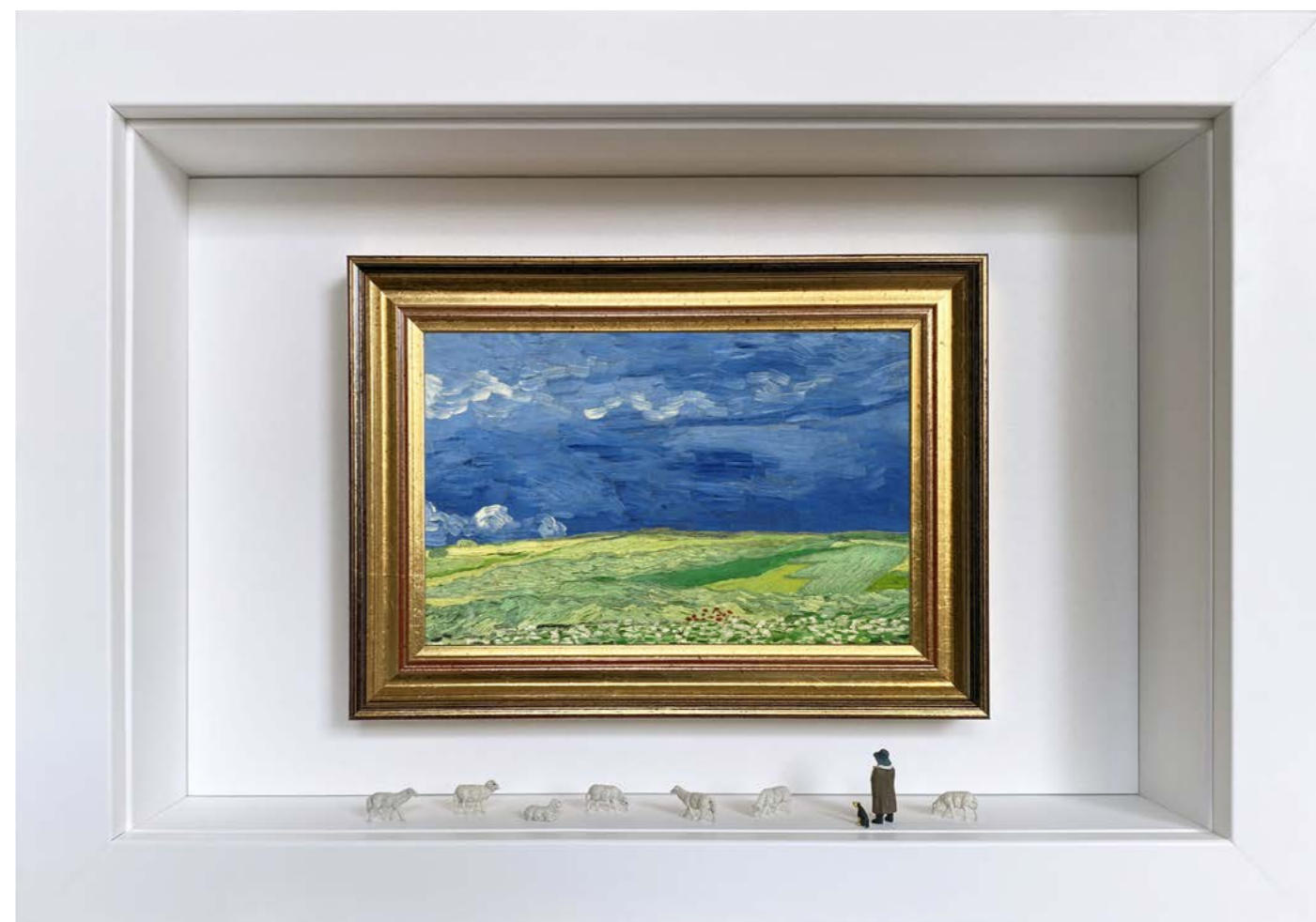
Day Tripper Édition limitée à 12 exemplaires - Limited edition of 12 34 x 24 x 6,5 cm - 13 x 9 x 2,5 inches Clin d'oeil à l'oeuvre Champ de blé sous des nuages d'orage de Vincent van Gogh (1890) A nod to the artwork Wheatfield Under Thunderclouds by Vincent van Gogh (1890)