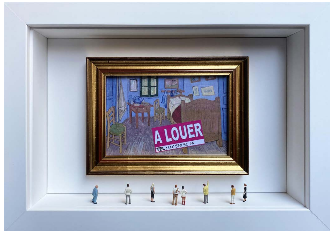
Room For Rent (Some characters may slightly vary) Édition limitée à 12 exemplaires - limited edition of 12 34 x 24 x 6,5 cm - 13 x 9 x 2,5 inches Clin d'oeil à l'oeuvre La Chambre de Van Gogh à Arles de Vincent van Gogh (1889) A nod to the artwork Bedroom in Arles by Vincent van Gogh (1889)