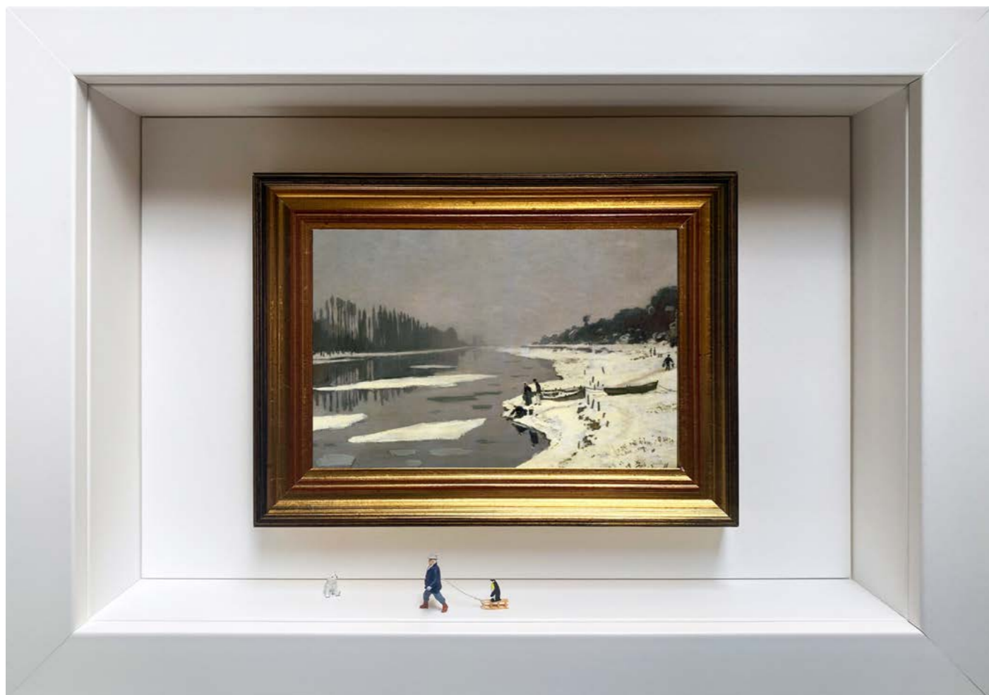
When We Ride

Édition limitée à 12 exemplaires - limited edition of 12