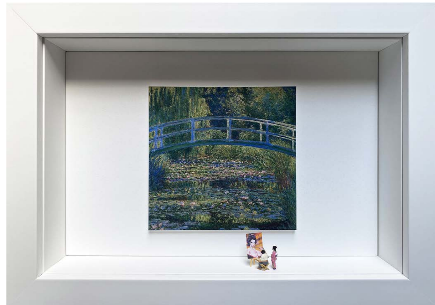
Nymphe Édition limitée à 12 exemplaires - Limited edition of 12 34 x 24 x 6,5 cm - 13 x 9 x 2,5 inches Clin d'oeil à l'oeuvre Le Bassin aux Nymphéas et le Pont japonais de Claude Monet (1899) A nod to the artwork Water Lilies and Japanese Bridge by Claude Monet (1899)