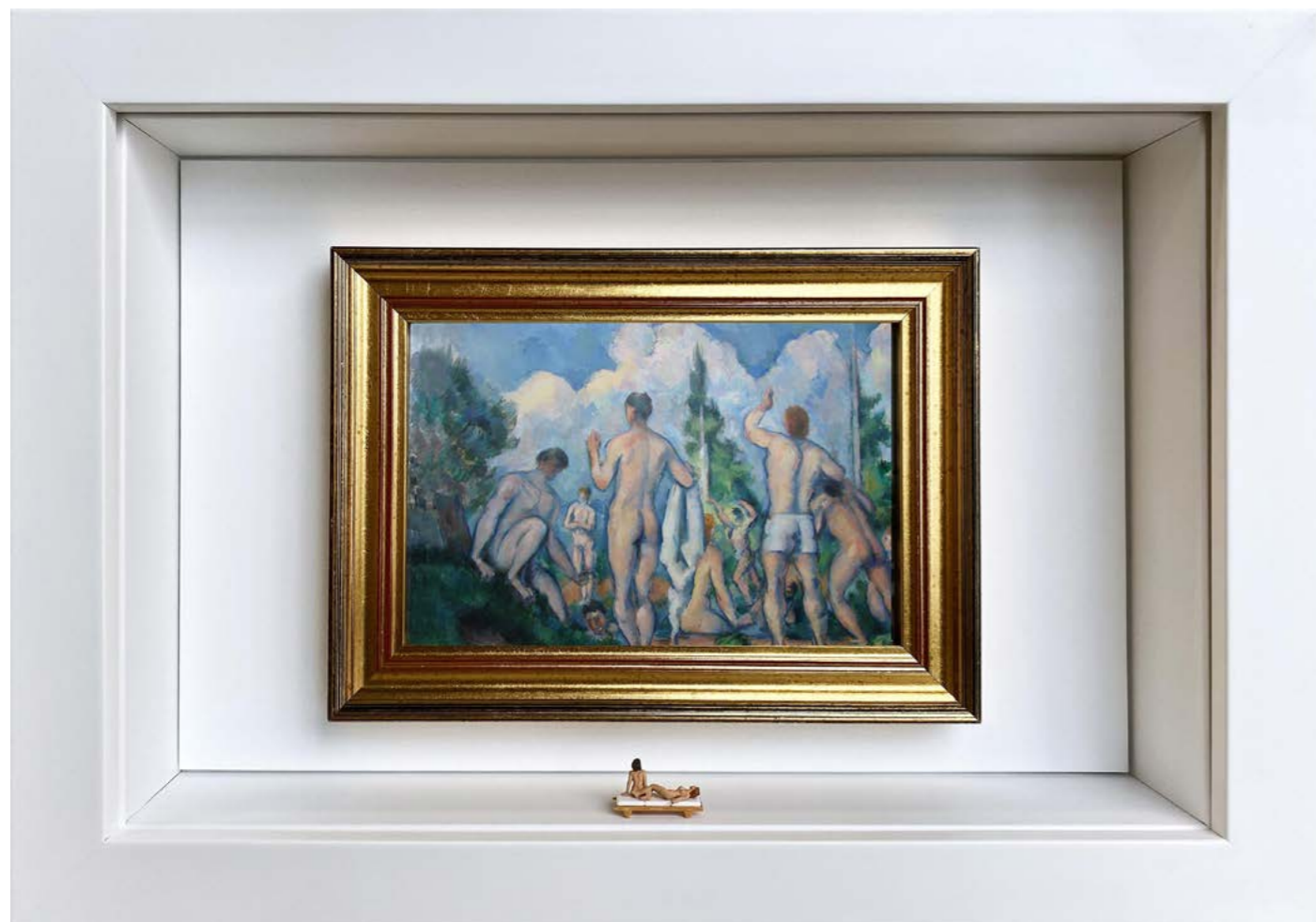
Peep Show Édition limitée à 12 exemplaires - Limited edition of 12 34 x 24 x 6,5 cm - 13 x 9 x 2,5 inches Clin d'oeil à l'oeuvre Les Baigneurs de Paul Cézanne (1890) A nod to the artwork Bathers by Paul Cézanne (1890)