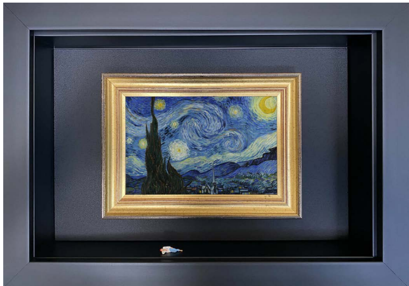
The Dream Édition limitée à 12 exemplaires - limited edition of 12 34 x 24 x 6,5 cm - 13 x 9 x 2,5 inches Clin d'oeil à l'oeuvre La Nuit étoilée (à Saint-Rémy-de-Provence) de Vincent Van Gogh (1889) A nod to the artwork The Starry Night (in Saint-Rémy-de-Provence) by Vincent Van Gogh (1889)