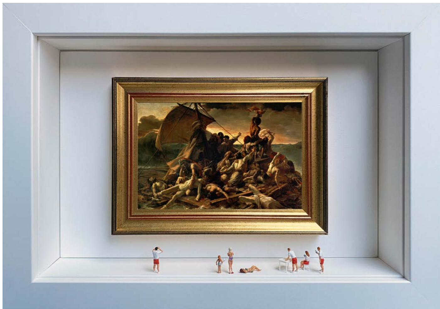
Baywatch (Some characters may slightly vary) Édition limitée à 12 exemplaires - Limited edition of 12 34 x 24 x 6,5 cm - 13 x 9 x 2,5 inches Clin d'oeil à l'oeuvre Le Radeau de La Méduse de Théodore Géricault (1818 - 1819) A nod to the artwork The Raft of the Medusa by Théodore Géricault (1818 - 1819)