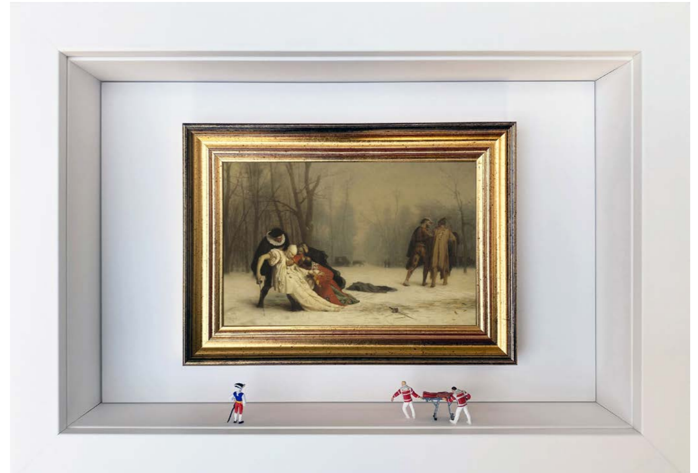
Afterparty Édition limitée à 12 exemplaires - Limited edition of 12 34 x 24 x 6,5 cm - 13 x 9 x 2,5 inches Clin d'oeil à l'oeuvre Suites d'un bal masqué de Jean-Léon Gérôme (1857) A nod to the artwork The Duel After the Masquerade by Jean-Léon Gérôme (1857)