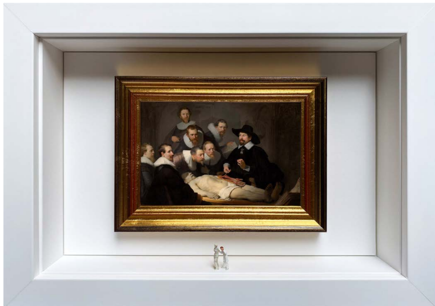
Gray's Anatomy Édition limitée à 12 exemplaires - limited edition of 12 34 x 24 x 6,5 cm - 13 x 9 x 2,5 inches Clin d'oeil à l'oeuvre La Leçon d'anatomie du docteur Tulp de Rembrandt (1632) A nod to the artwork The Anatomy Lesson of Dr. Nicolaes Tulp by Rembrandt (1632)