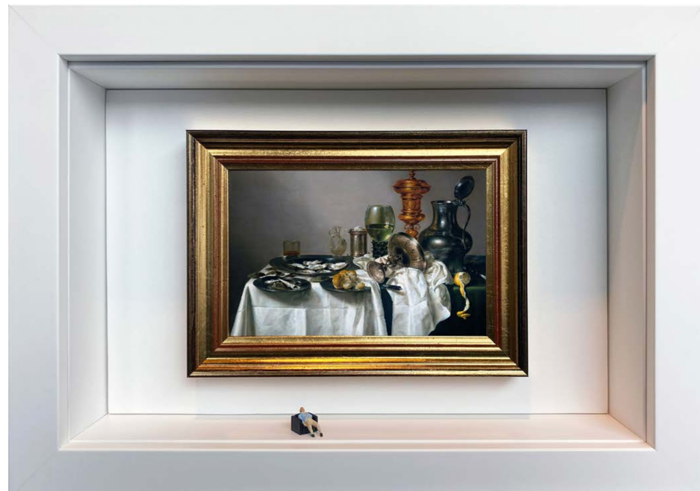
Natures Mortes Édition limitée à 12 exemplaires - limited edition of 12 34 x 24 x 6,5 cm - 13 x 9 x 2,5 inches Clin d'oeil à l'oeuvre Nature morte au gobelet doré de Willem Claesz Heda (1635) A nod to the artwork Still Life with Gilt Goblet by Willem Claesz Heda (1635)