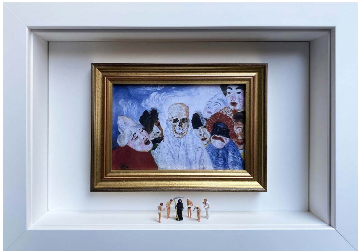
Let me breathe! Édition limitée à 12 exemplaires - Limited edition of 12 34 x 24 x 6,5 cm - 13 x 9 x 2,5 inches Clin d'oeil à l'oeuvre La Mort et les masques de James Ensor (1897) A nod to the artwork Death and the Masks by James Ensor (1897)