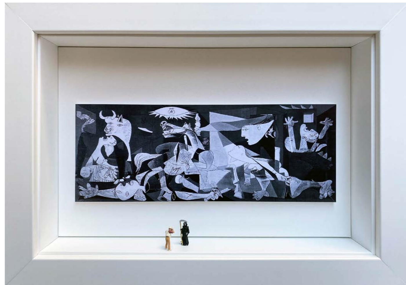
Masterpiece Édition limitée à 12 exemplaires - Limited edition of 12 34 x 24 x 6,5 cm - 13 x 9 x 2,5 inches Clin d'oeil à l'oeuvre Guernica de Pablo Picasso (1937) A nod to the work Guernica by Pablo Picasso (1937)