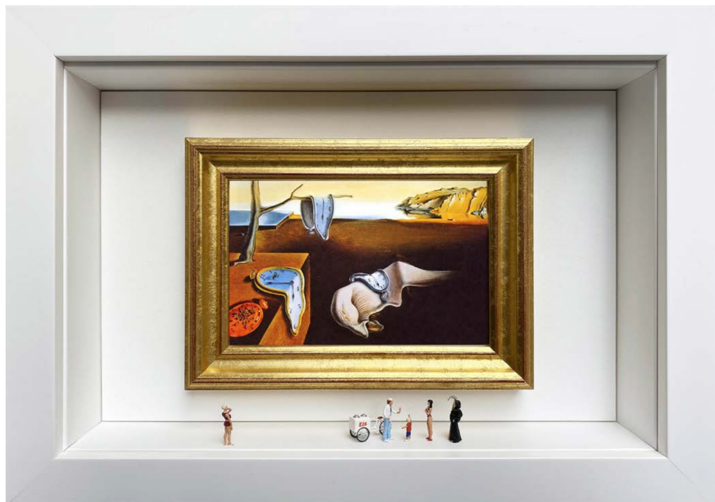
A Well-Deserved Break (Some characters may slightly vary) Édition limitée à 12 exemplaires - Limited edition of 12 34 x 24 x 6,5 cm - 13 x 9 x 2,5 inches Clin d'oeil à l'oeuvre La Persistance de la mémoire de Salvador Dalí (1931) A nod to the artwork The Persistence of Memory by Salvador Dalí (1931)