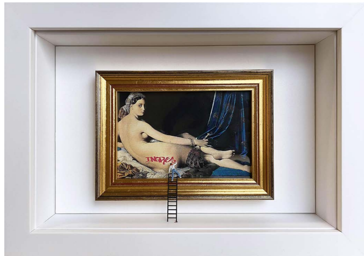
Dédicace Édition limitée à 12 exemplaires - Limited edition of 12 34 x 24 x 6,5 cm - 13 x 9 x 2,5 inches Clin d'oeil à l'oeuvre La Grande Odalisque de Jean-Auguste-Dominique Ingres (1814) A nod to the artwork Grande Odalisque by Jean-Auguste-Dominique Ingres (1814)