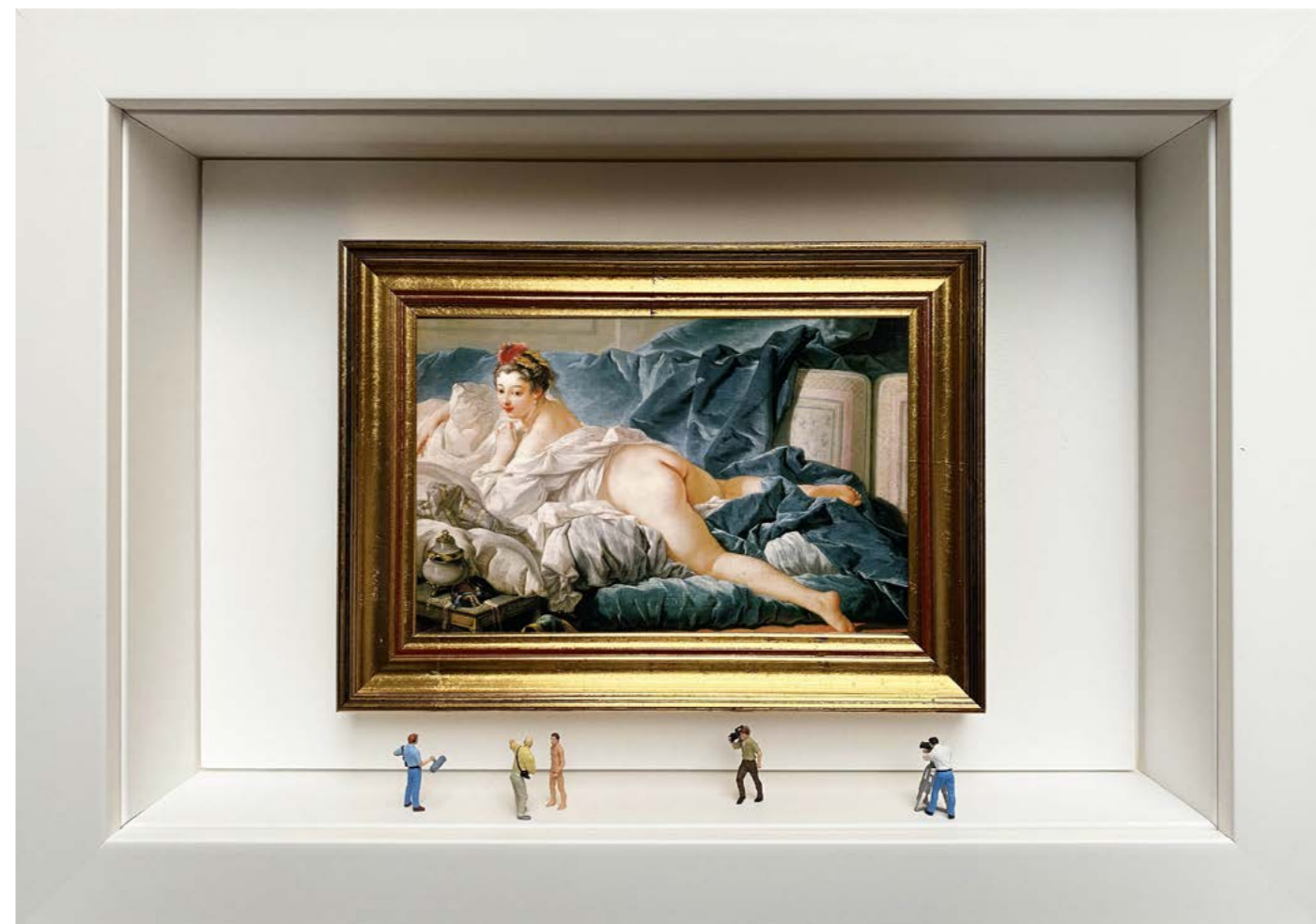
OdaliX Édition limitée à 12 exemplaires - Limited edition of 12 34 x 24 x 6,5 cm - 13 x 9 x 2,5 inches Clin d'oeil à l'oeuvre L'Odalisque de François Boucher (1745) A nod to the artwork The Brunette Odalisque by François Boucher (1745)