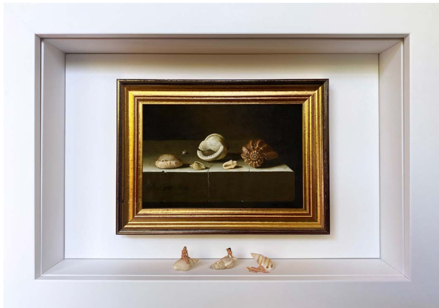
Natures vivantes (Some sea shells may slightly vary) Édition limitée à 12 exemplaires - Limited edition of 12 34 x 24 x 6,5 cm - 13 x 9 x 2,5 inches Clin d'oeil à l'oeuvre Six Coquillages sur une table de pierre d'Adriaen Coorte (1696) A nod to the artwork Six Shells on a Stone Table by Adriaen Coorte (1696)