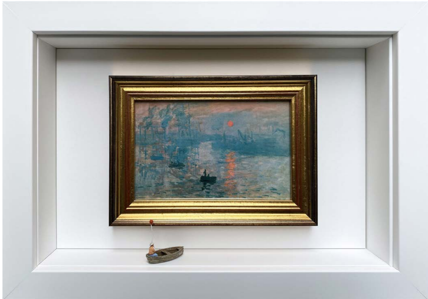
Orange bleue Édition limitée à 12 exemplaires - Limited edition of 12 34 x 24 x 6,5 cm - 13 x 9 x 2,5 inches Clin d'oeil à l'oeuvre Impression, soleil levant de Claude Monet (1872) A nod to the artwork Impression, Sunrise by Claude Monet (1872)