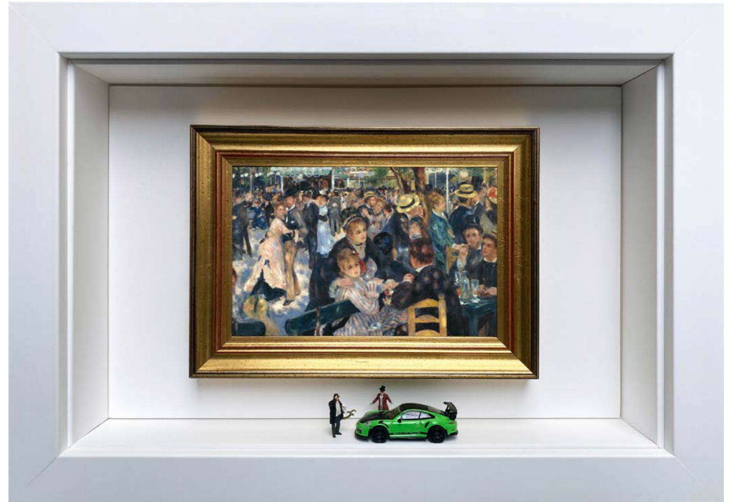
New Toy Édition limitée à 12 exemplaires - Limited edition of 12 34 x 24 x 6,5 cm - 13 x 9 x 2,5 inches Clin d'oeil à l'oeuvre Bal du moulin de la Galette de Pierre-Auguste Renoir (1876) A nod to the artwork Dance at Le moulin de la Galette by Pierre-Auguste Renoir (1876)