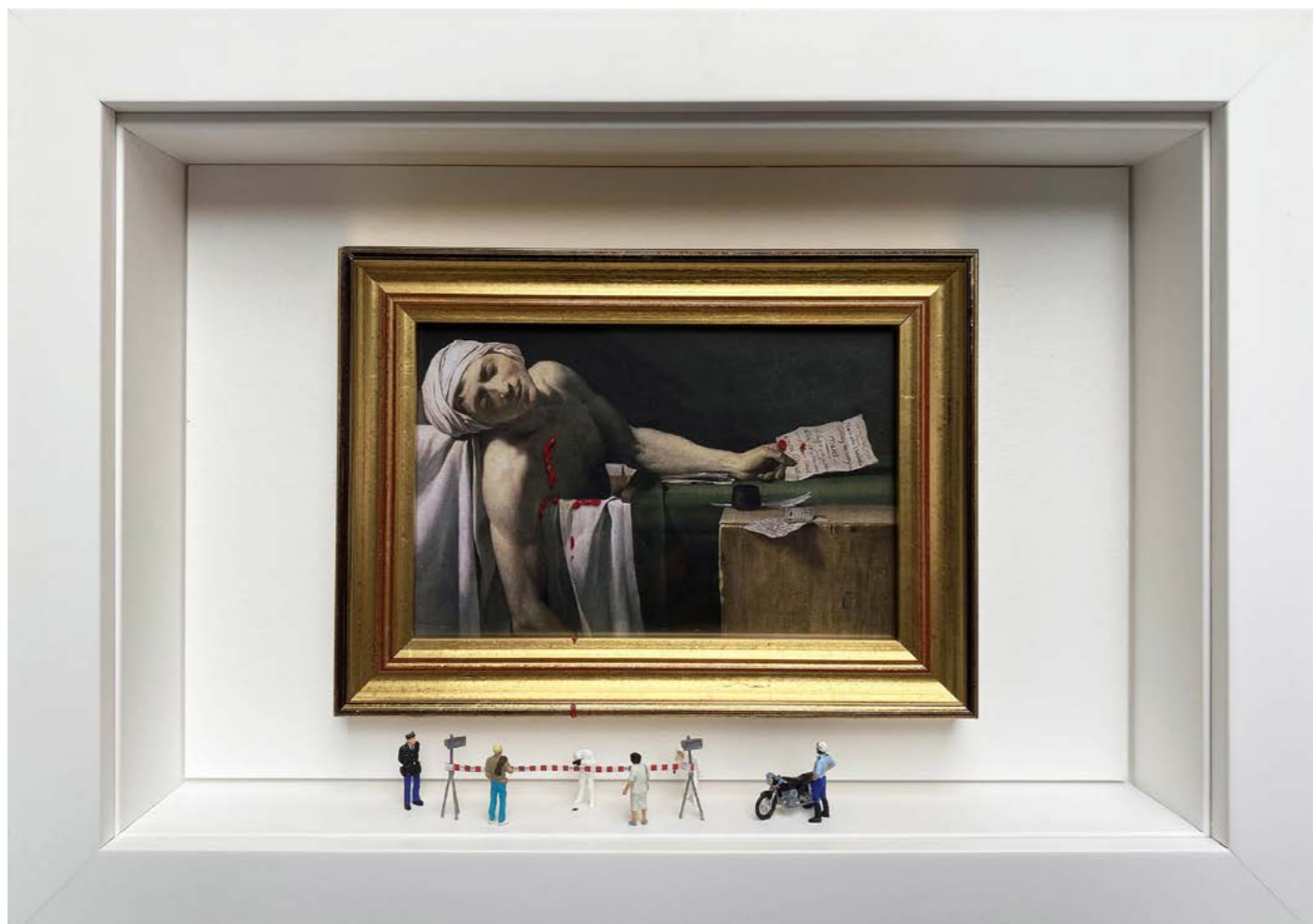
Do Not Cross (Some characters may slightly vary) Édition limitée à 12 exemplaires - Limited edition of 12 34 x 24 x 6,5 cm - 13 x 9 x 2,5 inches Clin d'oeil à l'oeuvre La Mort de Marat de Jacques-Louis David (1793) A nod to the artwork The Death of Marat by Jacques-Louis David (1793)